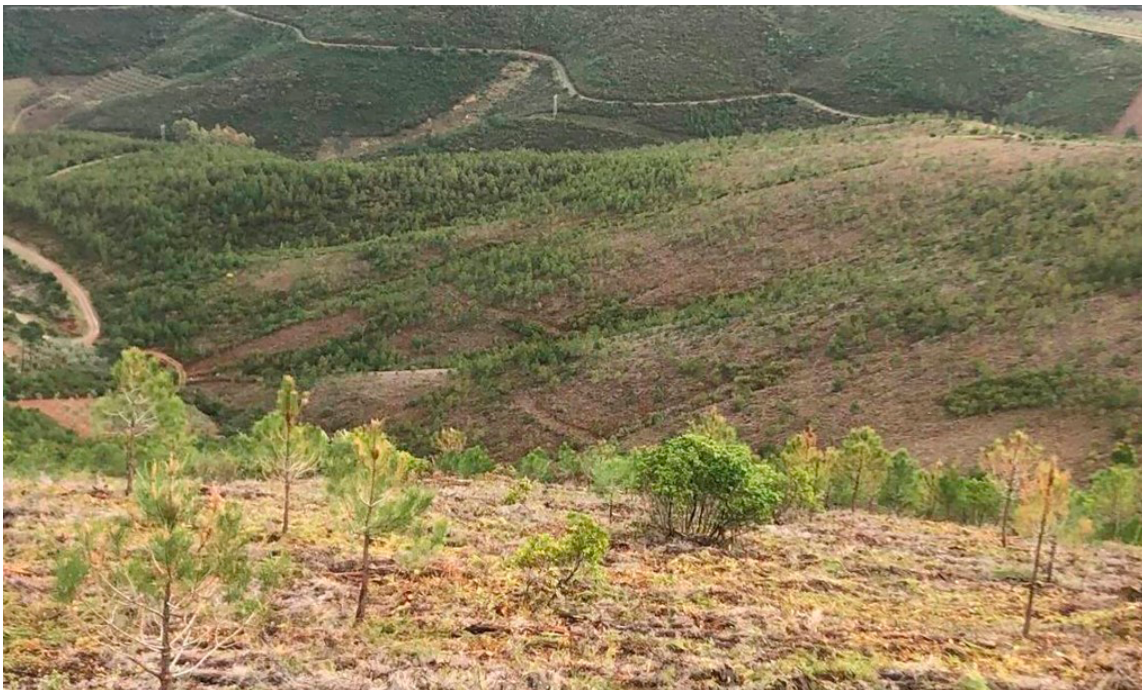
Bosque ILUNION (Caminomorisco, Cáceres)

Hemos puesto en marcha Bosque ILUNION, una iniciativa de compensación de emisiones de CO 2 , centrada en la reforestación y la regeneración forestal. La creación del bosque ha generado 15 puestos de trabajo en Caminomorisco (Cáceres) y permitirá la absorción de 13.514 toneladas de CO 2 hasta el año 2072. Esto supone la captura de 270 Tn CO 2 anuales.