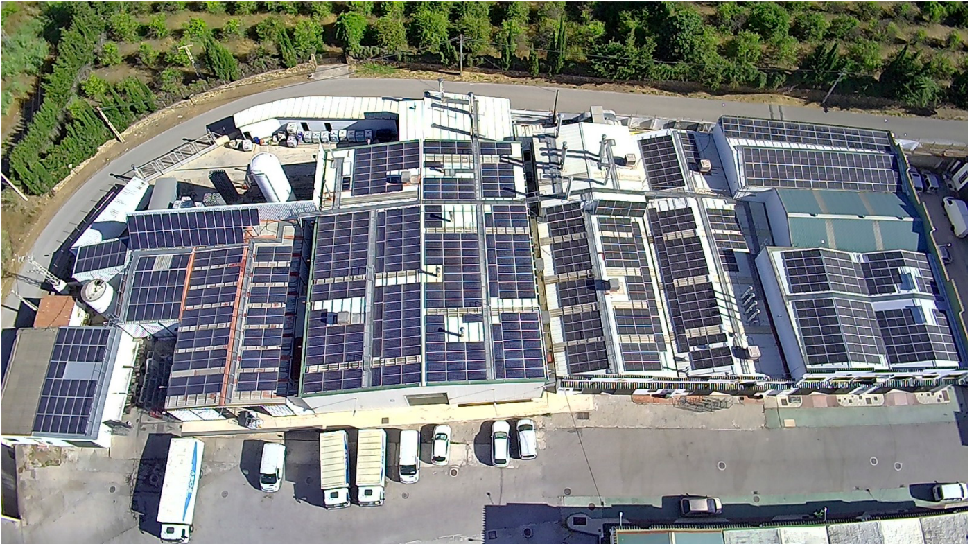
Lavandería Textil Rental (León)

De hecho, más del 40% de nuestras plantas industriales y hoteles cuentan con instalaciones de energía fotovoltaica para autoabastecimiento.